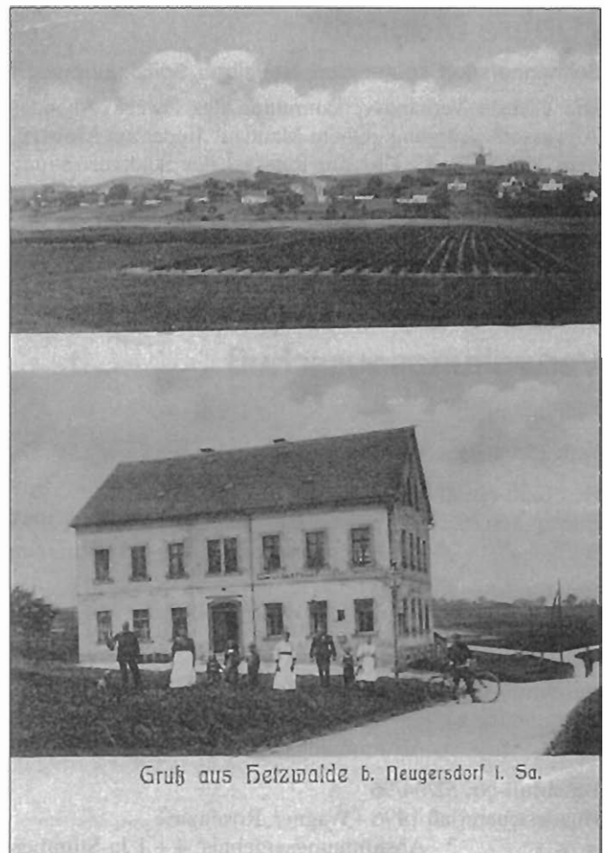
Gruß aus Hetzwalde b. Neugersdorf i. Sa.