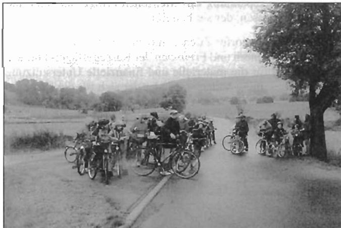
Kurze Verschnaufpause zwischen Mittelherwigsdorf und Niederoderwitz