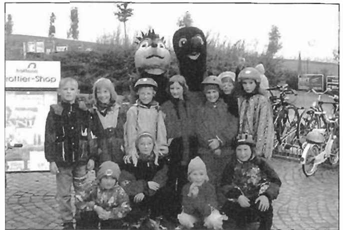
An der Sommerrodelbahn wurden wir von zwei lustigen Gesellen begrüßt.

Unser traditioneller Jahresabschluß fand am 7. November in der Turnhalle statt. Das Stiftungsfest, anlässlich „137 Jahre Turnen in Spitzkunnersdorf“, fand wieder großen Anklang bei den zahlreichen Besuchern. Die aktiven Teilnehmer von der Vorschulgruppe bis zu unseren Senioren waren mit viel Spaß und Freude dabei, ihr Können dem Publikum zu präsentieren. So konnten die Zuschauer erleben, wie unsere Kleinsten spielerisch an das Turnen herangeführt werden. Aber auch unsere Senioren stellten unter Beweis, daß sie noch lange nicht zum alten Eisen gehören.