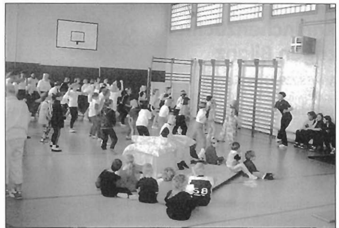
Am Beginn steht zur Erwärmung eine gemeinsame Gymnastik auf dem Programm. Die Vorschulgruppe im Vordergrund wartet schon auf ihren Auftritt.

Unser traditioneller Jahresabschluß fand am 7. November in der Turnhalle statt. Das Stiftungsfest, anlässlich „137 Jahre Turnen in Spitzkunnersdorf“, fand wieder großen Anklang bei den zahlreichen Besuchern. Die aktiven Teilnehmer von der Vorschulgruppe bis zu unseren Senioren waren mit viel Spaß und Freude dabei, ihr Können dem Publikum zu präsentieren. So konnten die Zuschauer erleben, wie unsere Kleinsten spielerisch an das Turnen herangeführt werden. Aber auch unsere Senioren stellten unter Beweis, daß sie noch lange nicht zum alten Eisen gehören.