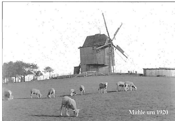
Mühle um 1920