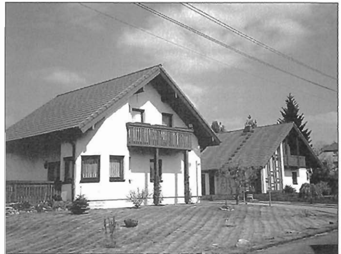
Neubauten Oststraße 15b/15c