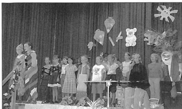
Auftritt der Klasse 4

auf diesen freudigen und wichtigen Tag ein, dessen Bedeutsamkeit durch die Worte der Schulleiterin, Frau Gründer, zum Ausdruck kam. Zum Schluss folgte ein Besuch des Klassenzimmers, um die schönen Bücher und Geschenke in Empfang zu nehmen.