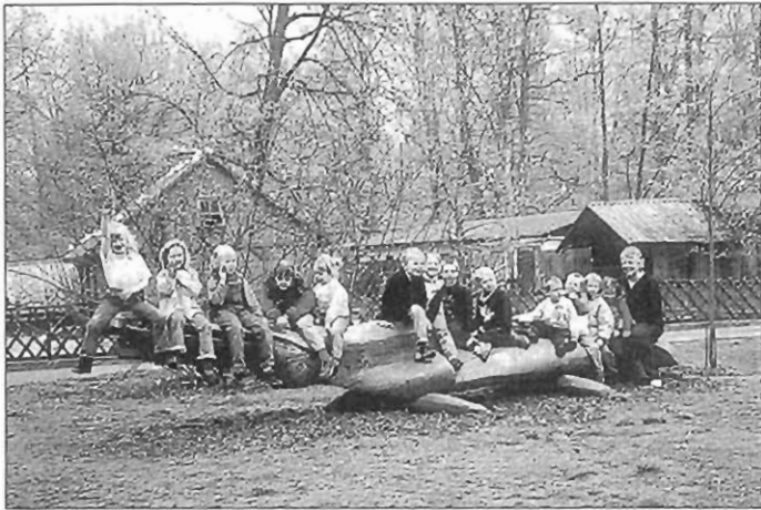
So, nun alle schnell nochmal auf's Krokodil und „bitte lächeln“. Dann ging's schon wieder nach Hause.