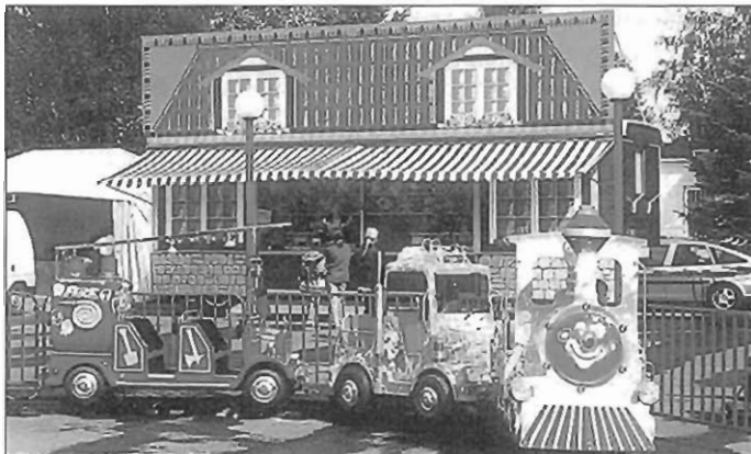
Leckerschdurfer Schiss'n 2000