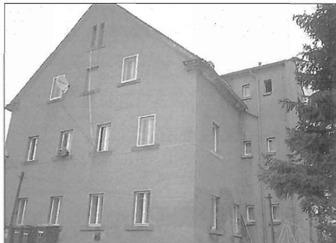
Dorfstraße 55 – Spitzkunnerdorf

Dorfstraße 55 700 m 2 4 ja ca. 7.000 (Wohn- und Gewerberaum)