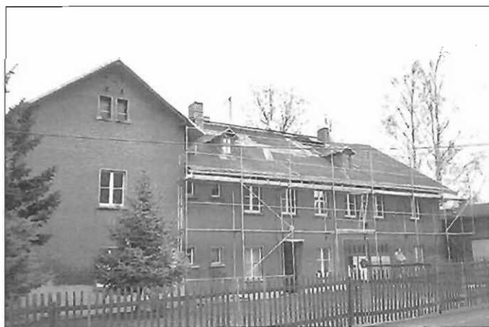
Bahnhofstraße 1 – Leutersdorf

Dorfstraße 55 700 m 2 4 ja ca. 7.000 (Wohn- und Gewerberaum)