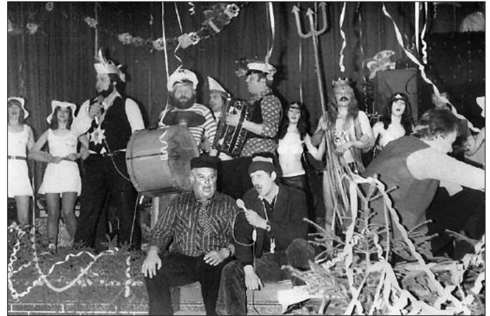
Funkgarde und Programm der 1. Saison

Im November 1983 wurde der Kunnerschdurger Karnevalsclub gegründet. Bereits mit der ersten Saison war es uns gelungen, die karnevalistischen Traditionen in Spitzkunnersdorf fortzuführen. Das Thema damals „Fischerfest am Hofeteich“.