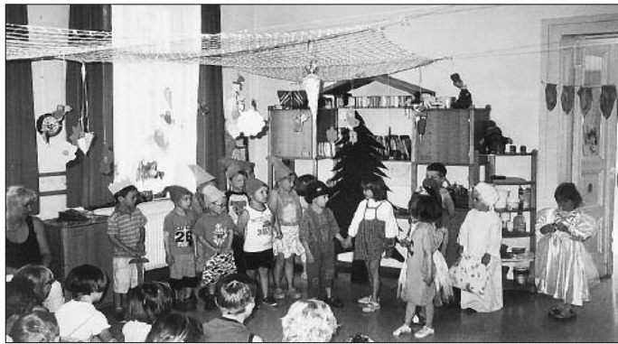
Es waren auch, nach fleißigem Gießen am Zuckertütenbaum wieder viele schöne bunte Tüten gewachsen.

Unser letzter Höhepunkt war das Zuckertütenfest, bei dem sich alle Kinder mit schönen Programmen bei uns verabschiedeten. Auch wir zeigten noch einmal, wie wir uns auf die Schule freuen und was wir schon gelernt haben.