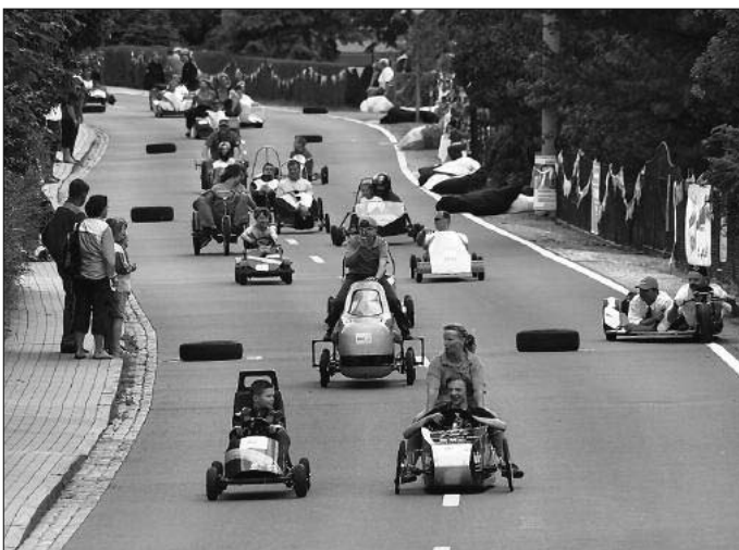
Gemeinsame Abschlussfahrt aller Seifenkisten beim Seifenkistenrennen 2008