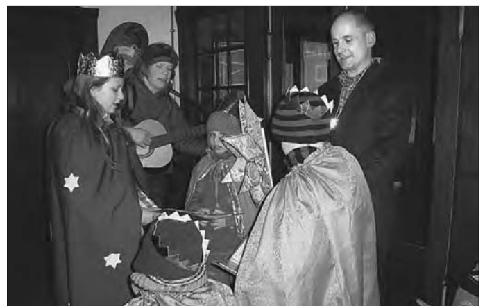
Bürgermeister empfängt Sternsinger