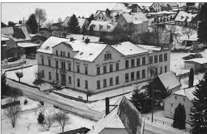
Blick auf Wohnhaus – Geschw.-Scholl.-Str. 8