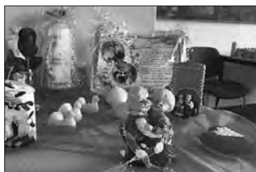
Ewig junge Liebe

Auch für kleine Besucher gibt es was zu entdecken