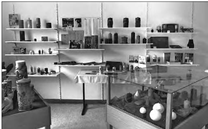
Blick in den Ausstellungsbereich der Ebersbacher Kerzenfabrik

Auch für kleine Besucher gibt es was zu entdecken