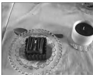
Lecker – aber „leider“ nur aus Wachs

Am Sonntag, dem 09. Oktober 2011 wurde die Sonderausstellung unseres Traditionsvereins Lindeberg e. V. Leutersdorf feierlich eröffnet. Unter dem Motto „Kerzen – Wärme, Licht und Harmonie“ entstand Dank der zahlreichen Unterstützung der Bevölkerung aus Nah und Fern eine wirklich sehenswerte Ausstellung. Besonders beeindruckend ist dabei für den Betrachter die Formen- und Farbenvielfalt der erworbenen, gesammelten oder mit viel Kreativität selbst gestalteten und dekorierten Kerzen. Manches entlockt ein ungläubiges Staunen – sind Bügel-eisen, Nähmaschine, Eisbecher oder Schokoladentörtchen wirklich Kerzen? Auch was eher wie Holz, Keramik oder leuchtend bunte Plaste erscheint, entpuppt sich beim näheren Hinschauen dann doch als Wachs. Sehr informativ und anschaulich präsentiert sich die Kerzenfabrik Ebersbach mit vielen interessanten Ausstellungsstücken aus der inzwischen über 60-jährigen Produktion.