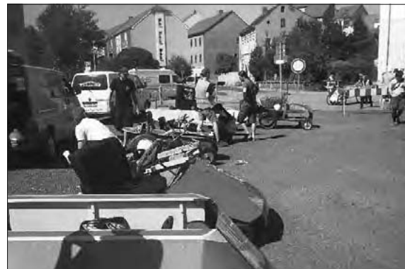
Beim Seifenkistenrennen in Zittau

Neben den MDC-Rennen waren unsere Seifenkisten noch in Zittau am Start. Der EMIL e.V. führte am 3. September ein Rennen über den Mandauer Berg durch. Mit der Seifenkiste „MS Fritz Heckert“ errangen wir den zweiten Platz.