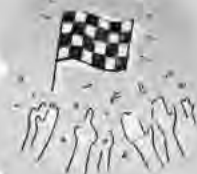
3. Verwirklichen Sie Ihr Projekt!

Jeder Mensch hat etwas, das ihn antreibt.