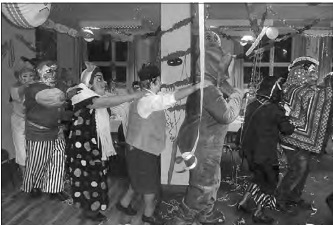
Aufstellung zum Gruppenfoto und Polonaise durch den Festsaal