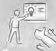
1. Stellen Sie die Idee für Ihr Projekt online vor!

Bald mehr unter www.VB-Loebau-Zittau.de .