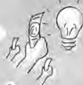
2. Jeder kann Ihr Projekt unterstützen!