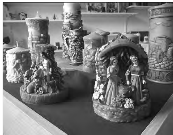
2011 Kerzen- aus- stellung

In der Vergangenheit sind unter Mitwirkung zahlreicher Einwohner bereits sehr sehenswerte und erfolgreiche Sonderausstellungen wie z.B. die Kerzen- oder Knopfausstellung entstanden.