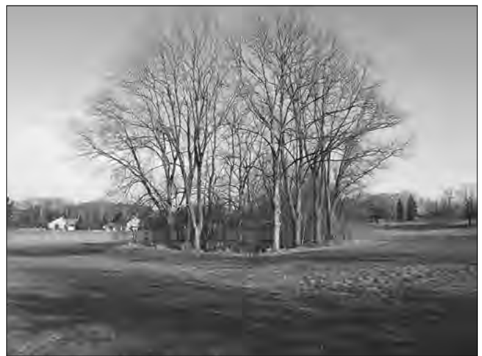
Bornteich hinter dem Koerneritzgut