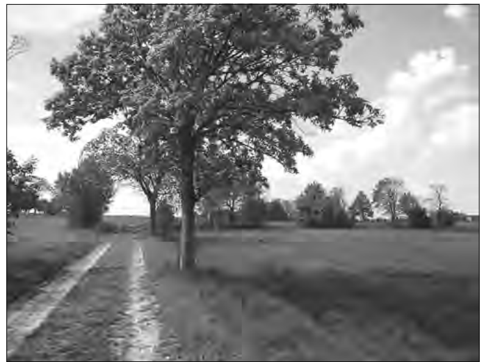
Weg nach Hetzwalde