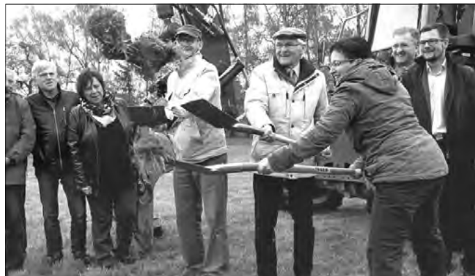
Gemeinsamer 1. Spatenstich für neue Seniorenwohnanlage

Vom Freistaat Sachsen erhalten wir weiterhin für dieses Jahr etwa 66 T€ für die Erhaltung unserer kommunalen Straßen. Wir werden mit diesem Geld in der Zeit von 6. Juni bis 15. Juli in Spitzkunnersdorf an der Hohle und in Leutersdorf auf der Geschwister-Scholl-Straße und Zur Heinrichshöhe in Teilflächen die Straßendecke abfräsen und neue Bitumendecken in einer Stärke von 6 cm auftragen. Wahrscheinlich wird auch in den kommenden Jahren annähernd die gleiche Summe vom Freistaat zur Verfügung gestellt, um Straßenschäden nachhaltig zu beseitigen.