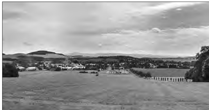
Blick von der Wache

Ein weiteres Problem besteht in unserer Gemeinde, wenn Sträucher und Bäume wieder das frische Grün bekommen. Dann wachsen diese auch in den Verkehrsraum (Straßen- und Fußwege) und werden zu einer Gefahrenstelle für die Nutzer des öffentlichen Verkehrsraumes. Leider müssen wir in der Gemeindeverwaltung feststellen, dass jedes Jahr diese Probleme fast immer bei den gleichen Grundstücken auftreten. Ich bitte ganz herzlich, dass jeder Grundstückseigentümer darauf achtet, dass der Rückschnitt, sowie im Gemeindeblatt im Monat Februar mitgeteilt, auch umgesetzt wird (alle Ausgaben des Gemeindeblattes finden Sie im Internet unter www.leutersdorf.de ). Wir möchten nicht, dass durch ein leichtsinniges Verhalten Unfälle verursacht werden. Bitte beachten Sie unbedingt, dass bei