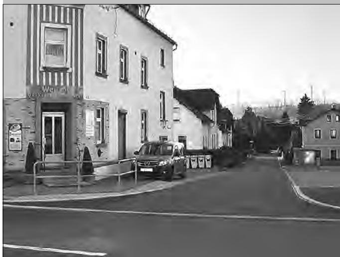
RW-Kanal und Deckenwiederherstellung Am Wehr, Leutersdorf