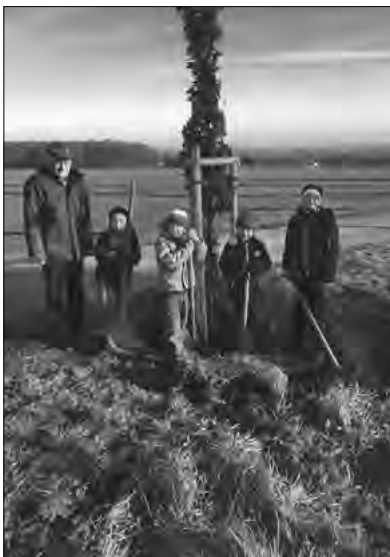
Schüler pflanzen Naturpark-Baum – eine Säuleneiche an der Wache

kehr übergeben werden. Leider konnte unsere Kinderkrippe nicht, wie im Stillen gehofft, noch im Jahr 2017 fertig gestellt werden. Dazu gab es verschiedene Ursachen, die ich nicht weiter ausbreiten möchte. Auch die Schadensbeseitigung am Spitzkunnersdorfer Wasser, Dorfstraße 63–65, ist eine Baustelle, die uns als Gemeindeverwaltung sehr viele Probleme gebracht hat. Wir hoffen aber, dass wir die beiden letztgenannten Baumaßnahmen im 1. Halbjahr des kommenden Jahres fertig stellen.