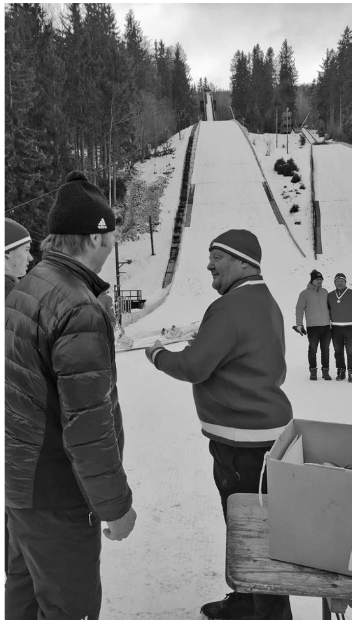
Der Verantwortliche von Harrachov bei der Überreichung des „Ski's“, die zu einem runden Jubiläum oder auch einem runden Geburtstag überreicht werden.

Den ersten Arbeitseinsatz mit reger Beteiligung haben wir auch schon durchgeführt. Das Schneehaltesystem wurde abgebaut und die Schanzenanlage in Ordnung gebracht. Vielen Dank an alle Mitwirkenden.