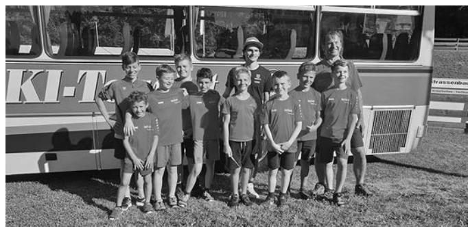
Skispringer der Abteilung Wintersport mit Skispringer Richard Freitag