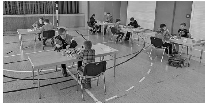
Kreis-Kinder- und Jugendspiele am 18. Juni 2022 in der Turnhalle Leutersdorf

Am 18. Juni 2022 trafen sich im Rahmen der Kreiskinder- und Jugendspiele 35 junge Schachsportler der Ak U8 bis U16 an der traditionsreichen Wettkampfstätte, um Sieger und Platzierte zu ermitteln. Die Kinder aus Leutersdorf und Spitzkunnersdorf waren bei der Medaillenjagd erfolgreich mit von der Partie. Schach in Leutersdorf lebt also und die Turnhalle ist ein Ort, wo Schach Spaß macht. Vielen Dank an die Gemeinde, die diese tolle Möglichkeit bietet. (fpr)