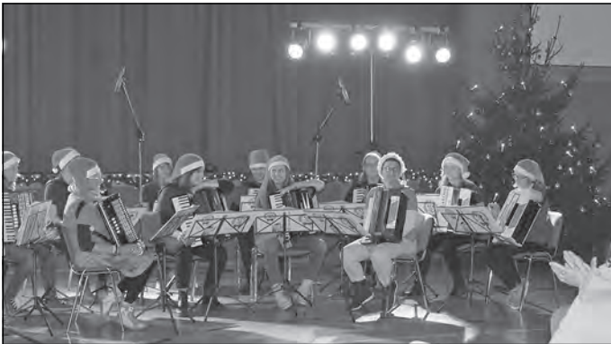
Seniorenweihnachtsfeier Musikschule Fröhlich