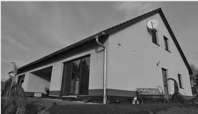
Einfamilienhaus Aloys-Scholze-Straße 12 f