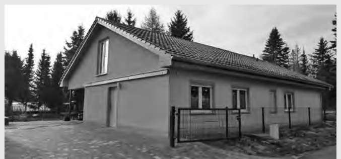
Einfamilienhaus Neueibauer Weg 6