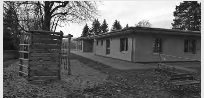
Neuer Kindergarten Villa Kunterbunt