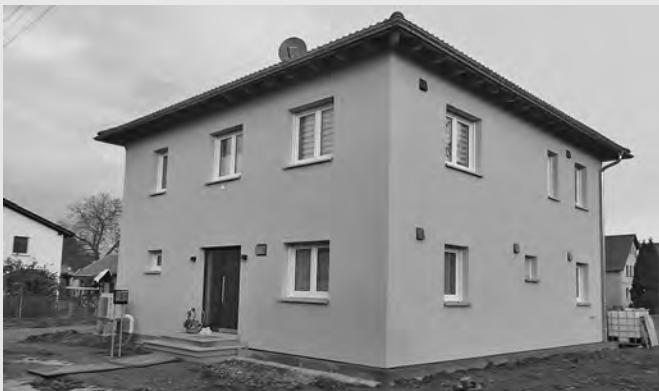
Einfamilienhaus Niedere Zeile 3