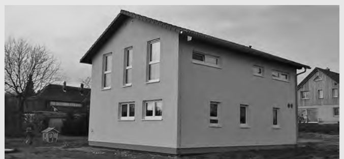
Einfamilienhaus Weberstraße 43 b