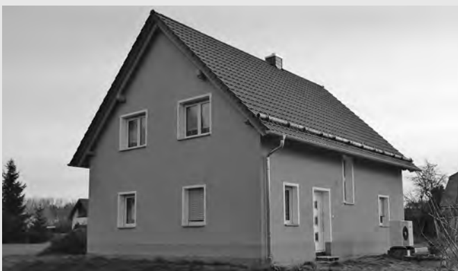
Einfamilienhaus Niedere Zeile 11