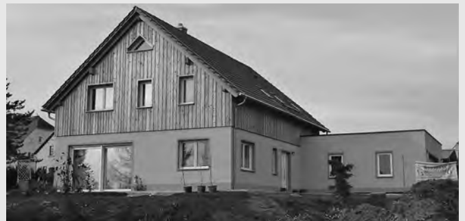
Einfamilienhaus Weberstraße 43 a