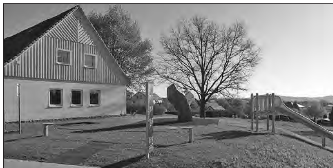
Spielplatzöffnung am 1. Juni 2023 (neben dem Feuerwehrdepot)

Wie bereits im Gemeindeblatt Februar 2023 angekündigt, werden wir am 1. Juni zum Kindertag den Kinderspielplatz in Spitzkunnersdorf und die Fitnessgeräte einweihen. Wir laden ganz herzlich für 16:00 Uhr unsere Kinder mit ihren Eltern und Großeltern sowie alle Interessierten zur Eröffnung ein. An diesem Tag können alle Geräte das Erste mal ausprobiert werden. Hoffentlich bleibt an diesem Tag auch das Wetter recht freundlich. Auch alle Erwachsenen, welche sich sportlich betätigen wollen, können dort die Fitnessgeräte austesten. Wir hoffen, dass viele dieser Einladung folgen.