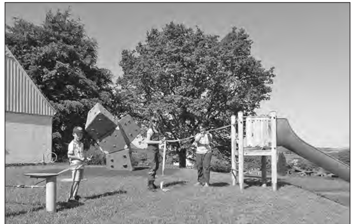
Übergabe Spielplatz und Fitnessgeräte

Am 1. Juni zum Kindertag hatten wir unsere Kinder, Eltern und Großeltern zur Übergabe des Spielplatzes und der Fitnessgeräte (für Erwachsene) nach Spitzkunnersdorf eingeladen. Bei herrlichem Wetter kamen viele Kinder mit ihren Eltern bzw. Großeltern. Nach einer obligatorischen Eröffnung in Verbindung mit dem Durchschneiden des Bandes, konnten der Spielplatz und die Geräte ausprobiert werden. Die Gesamtkosten für das Vorhaben betragen ca. 85.000,00 €. Dafür haben wir ca. 60.000,00 € an Fördermitteln erhalten und 25.000,00 € aus Eigenmitteln der Gemeinde finanziert. Ich denke das ist gut angelegtes Geld für unsere Kinder und auch für unsere sportlich bewussten Einwohner, die diese Fitnessgeräte bestimmt nutzen werden. Hier möchte ich ganz besonders Frau Cornelia Kunze Dank sagen, für die vielen Absprachen und hartnäckigen Forderungen gegenüber dem Baubetrieb, so dass nun endlich diese schöne Anlage am Kindertag übergeben werden konnte.