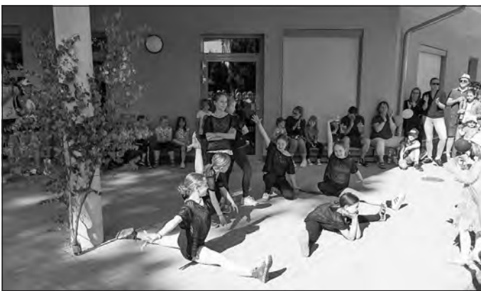
Sommerfest „Villa Kunterbunt“

Die Atmosphäre bei allen Veranstaltungen war sehr angenehm und für das leibliche Wohl wurde ausreichend gesorgt. Ich möchte mich bei allen, die die Veranstaltungen vorbereitet und durchgeführt haben, recht herzlich bedanken. Jede Veranstaltung hat dazu beigetragen, dass die Einwohner unserer Gemeinde wieder etwas näher zusammengekommen sind. Wir wissen ja wie schlimm es gewesen ist, als wir nicht die Gelegenheit hatten, sol-