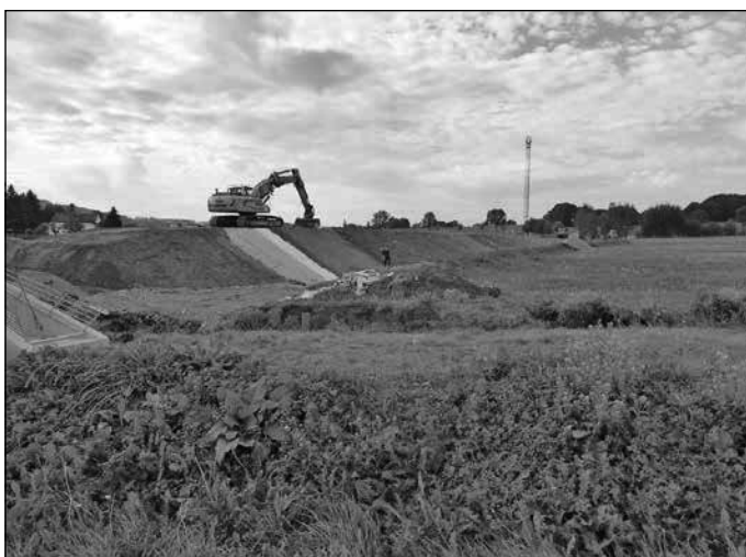
Retentionsfläche Siedlungsweg/Rückhaltebecken

Bei der Baumaßnahme „Rückhaltebecken am Siedlungsweg“ gibt es auch einen kleinen Terminverzug zu verzeichnen. Dort werden wir hoffentlich die Maßnahme Mitte November abschließen. Bei der Sanierung und Umbau der Villa am Zittauer Platz liegen wir einigermaßen gut im Plan und hoffen, dass noch die Außenfassade in den nächsten Tagen fertiggestellt wird und das Gerüst abgenommen werden kann. Bei der Fertigstellung des neuen Gemeindeamtes haben wir keinen Endtermin festgelegt.