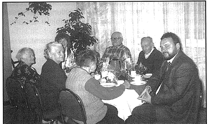
Besuch bei Spitzkunnersdorfern im Seniorenheim Niederoderwitz